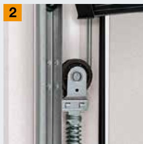
Système à ressorts de traction