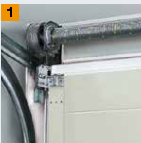
Technique à ressorts de torsion