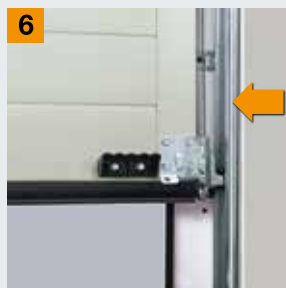
Guide de câble masqué

Plus de sécurité ? Adressez-vous à votre distributeur Hörmann !